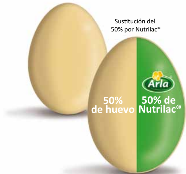
Cantidad de huevo en polvo